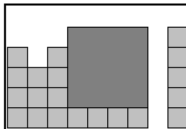
Rješenje drugog primjera – izbačena su tri gosta.